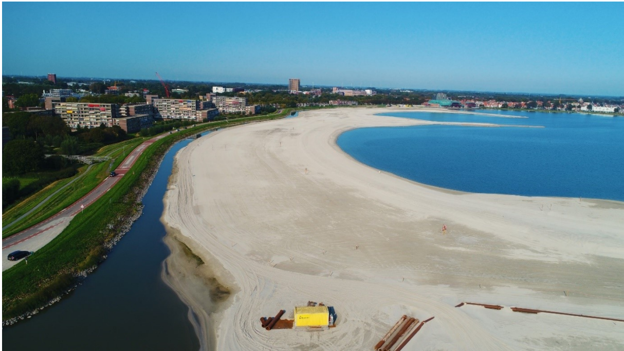
Foto 2: Strand Hoorn, module 2 van het dijkversterkingsproject Markermeerdijken.

Dijkversterking heeft maatschappelijke impact. Om die reden nemen we participatie en communicatie met onze inwoners serieus. We laten zo vroeg mogelijk in het proces weten op welke wijze we onze inwoners betrekken. Waar mogelijk voeren we in samenwerking met anderen projecten integraal of in samenhang uit.