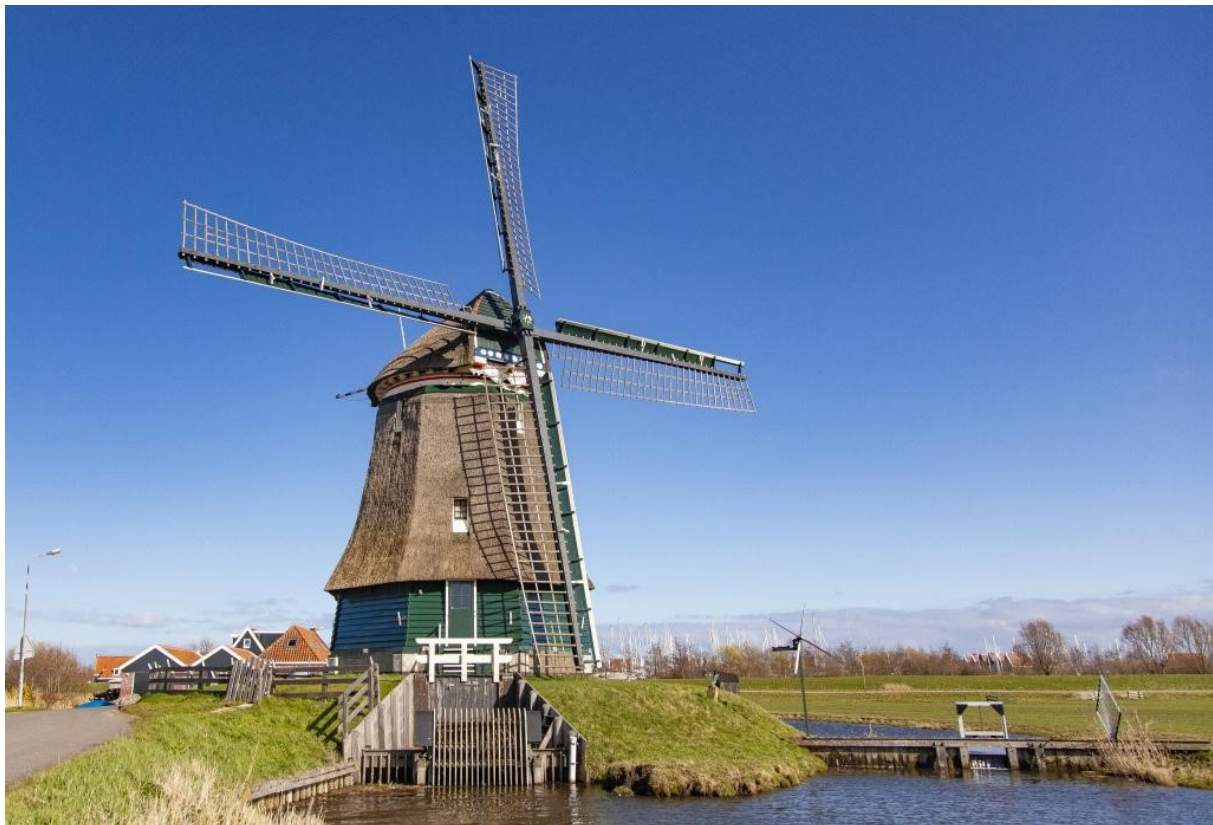
Foto 7: De Kathammer of Katwoudermolen bemaalt nog altijd het oostelijk deel van de polder Katwoude.

Waar mogelijk en effectief kunnen historische gemalen en poldermolens een goede bijdrage leveren in het snel verwerken van clusterbuien, waardoor een goede draairegeling nodig is.