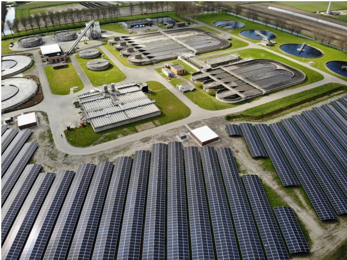
Foto 1. Zonneweide bij de rioolwaterzuiveringsinstallatie in Wervershoof.

Internationaal bieden wij via de Unie van Waterschappen op verzoek noodhulp. Ook zetten we onze kennis en ervaring in de focuslanden van de Unie in. Hiermee ondersteunen we daar de opbouw van noodzakelijke kennis en kunde op het terrein van waterbeheer en waterveiligheid.