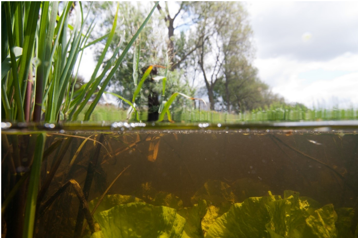
Foto 3: Troebel water leidt tot zuurstoftekort en een verarmde biodiversiteit.

De visstand is een belangrijk onderdeel van de waterkwaliteit en de visvriendelijkheid van de gemalen, vispasseerbaarheid bij waterstaatswerken en het visstandsbeheer moeten daarop afgestemd zijn. Met de Kadernota vis geven we hier invulling aan.