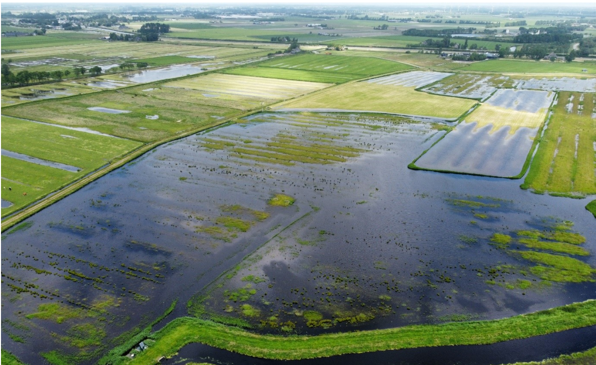
Foto 6: Wateroverlast als gevolg van de extreme buien in juni 2021.

Onze omgeving vraagt van ons dat wij 24/7 beschikbaar en bereikbaar zijn en adequaat handelen bij incidenten en calamiteiten. Dat is onze maatschappelijke verantwoordelijkheid. In geval van crisis treedt HHNK slagvaardig op. Om goed voorbereid te zijn, werken we aan informatievoorziening, trainingen en grootschalige oefeningen. Ook is de inzet van vrijwilligers een mogelijkheid. Tegelijkertijd volgen we het advies vanuit het Rijk om het meerlaagsveiligheidsdenken centraal te stellen en uit te breiden met het vergroten van het waterbewustzijn en snel herstel.