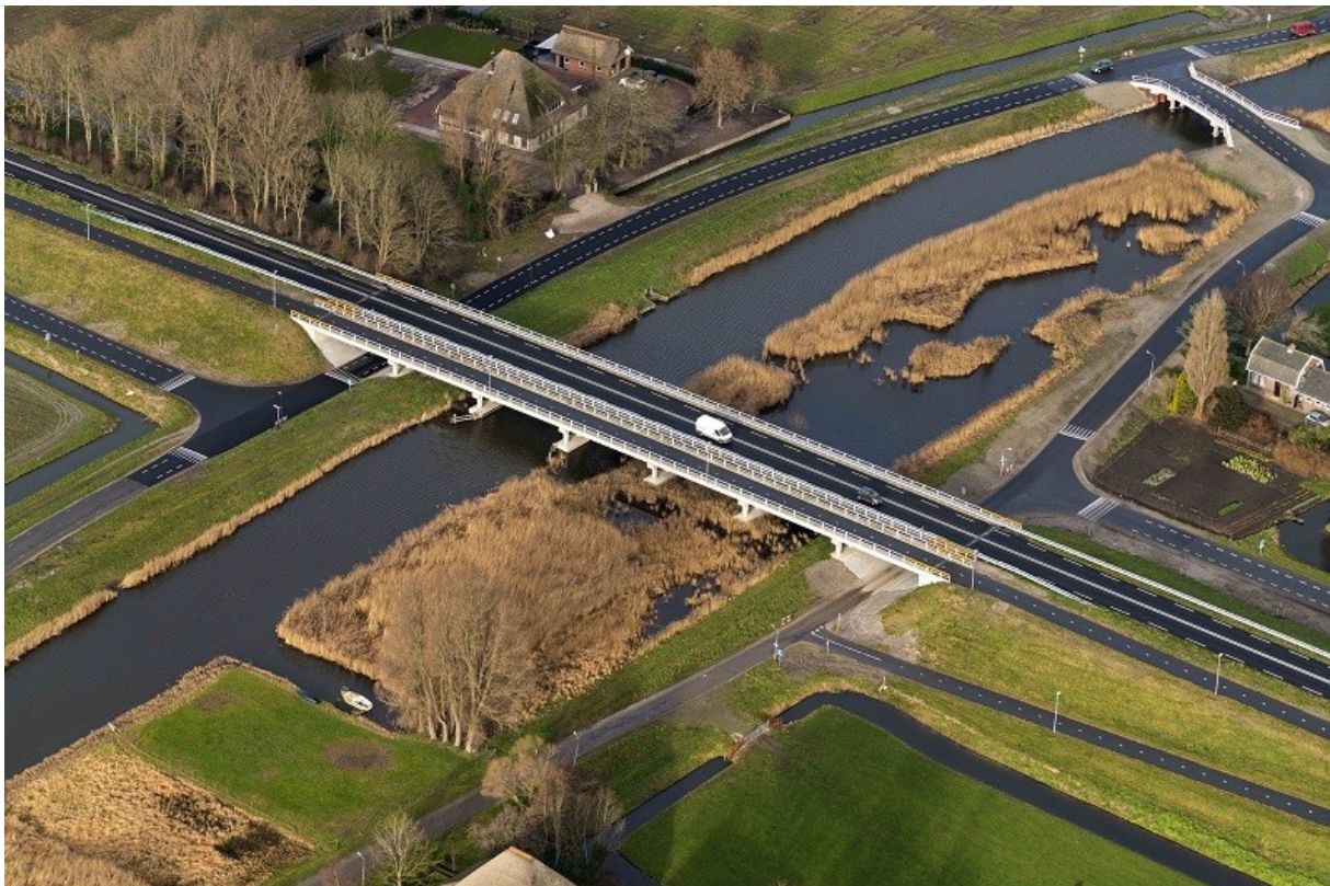
Foto 5. Luchtfoto van de N194 op de grens van gemeenten Dijk en Waard en Koggenland. Naast de natuurvriendelijke oever liggen wegen die per 1 januari 2023 zijn overgedragen aan de gemeente Koggenland.

HHNK heeft vanuit het verleden in een deel van het beheergebied het wegenbeheer als neventaak. In 2014 zijn we begonnen met het overdragen van de wegen aan de gemeenten. We streven ernaar om de wegen in 2025 overgedragen te hebben aan de laatste vijf gemeenten. Totdat alle wegen zijn overgedragen beheert HHNK de wegen als goed huisvader en staat veiligheid op de eerste plaats.